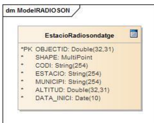
Figura 1. Esquema físic del model de dades de la RSBCN en el format SHP (data creació: 06/07/2017).

A l'apartat 5.3 es descriuen les característiques dels diferents atributs de l'objecte.